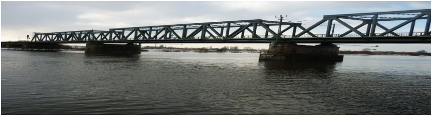
Die "Dreyer Brücke" Bindeglied zwischen Bremen & Niedersachsen