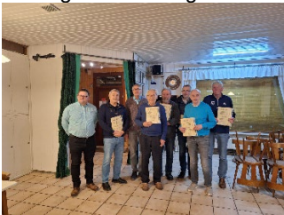
Bericht und Fotos: Thomas Loch

Im Anschluss fanden die Ehrungen statt, hier muss besonders erwähnt werden, dass Klaus-Dieter Böttcher, von der SG DB Delmenhorst für 60 jährige Mitgliedschaft geehrt wurde und darüber hinaus auch die Ehrenmitgliedschaft verliehen bekommen hat. Dafür gratuliert der gesamte Vorstand. Die Versammlung endete um 20.25 Uhr