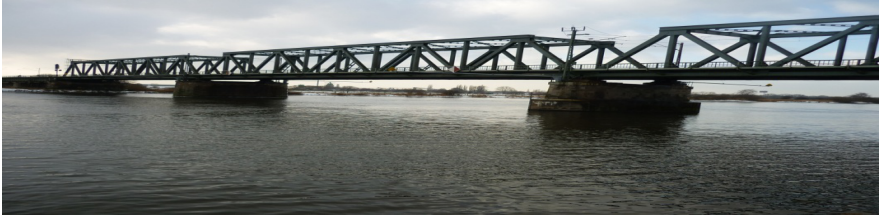
Die "Dreyer Brücke" Bindeglied zwischen Bremen & Niedersachsen